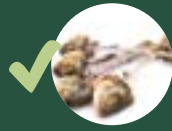
✓ 생선 찌꺼기와 생선뼈, 조개 껍데기