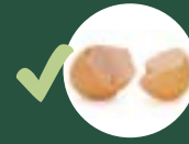
✓ 달걀 껍질