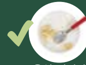
✓ 음식 찌꺼기