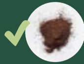
✓ 커피 찌꺼기와 차 잎