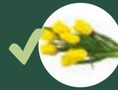
✓ 실내 장식용으로 자른 꽃들