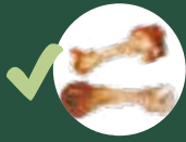
✓ 지방덩어리를 포함한 고기뼈 및 육류 찌꺼기