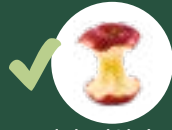
✓ 껍질, 과일 속씨, 줄기를 포함한 과일쓰레기